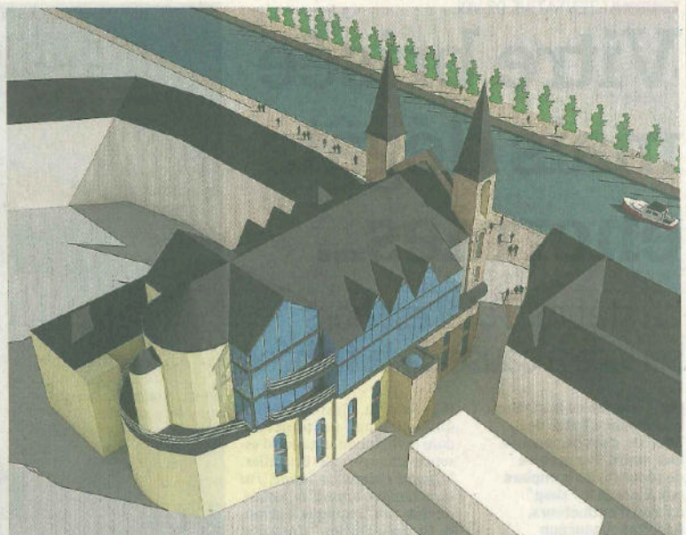
L'église changera de visage avec la verrière côté sud, en gardant tout son cachet