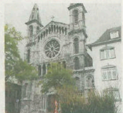
Une deuxième vie... B. LIBERT

ments de standing. Pour l'agent immobilier, il s'agissait d'un "challenge de la réhabilitation" de cette église. Puis, il a été question d'y installer un parking au rez-de-chaussée et des logements au-dessus, mais le projet a finalement été abandonné courant 2009 malgré l'obtention des permis. Pourtant, il ne manquait plus qu'un promoteur et le constructeur adéquat. «